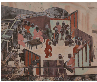
圖6 莫高窟第445窟「嫁娶圖」，李其璋臨摹。

420窟頂東坡的「西域商隊」、莫高窟第445窟北壁的「嫁娶圖」(圖6)、榆林窟第25窟北壁西側的「耕稼圖」、莫高窟第61窟的「五臺山圖局部」等4幅。