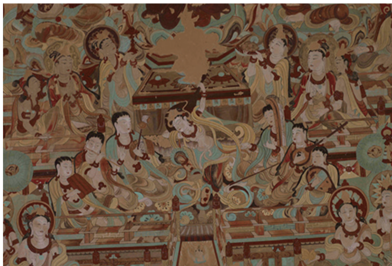
圖4 莫高窟第112窟「反彈琵琶舞樂圖」，吳榮鑒臨摹。