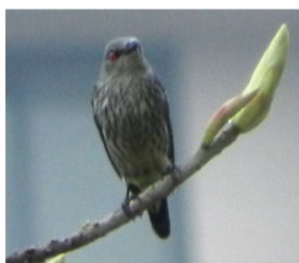
圖3 輝椋鳥的亞成鳥